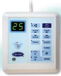
รีโมทมีสาย แบบมีตัวเลขไขว่จูนทุกปี (อุปกรณ์มาตรฐาน)